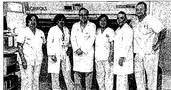
Se ha utilizado en 50 hospitales sobre más de 300.000 pacientes. / IT

Altomedicamentos, que hace un año recibió en Valencia el primer premio de Calidad de los Servicios de Farmacia, se diferencia de otros