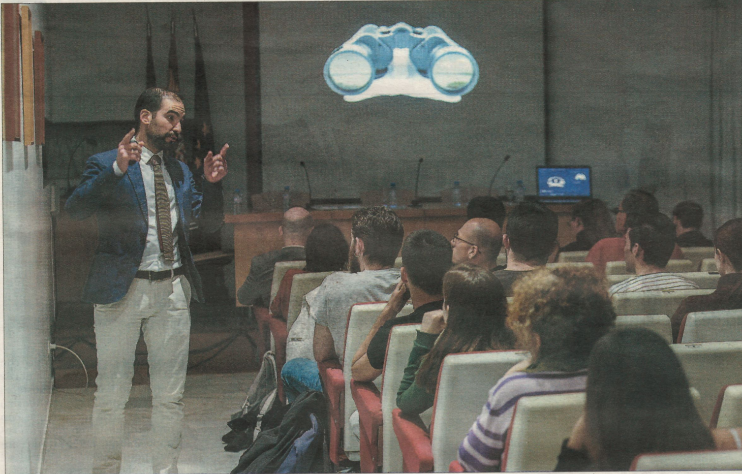
El ciclo de conferencias que ayer abrió el profesor López-Chaves proseguirá hasta mañana en la Facultad de Humanidades.