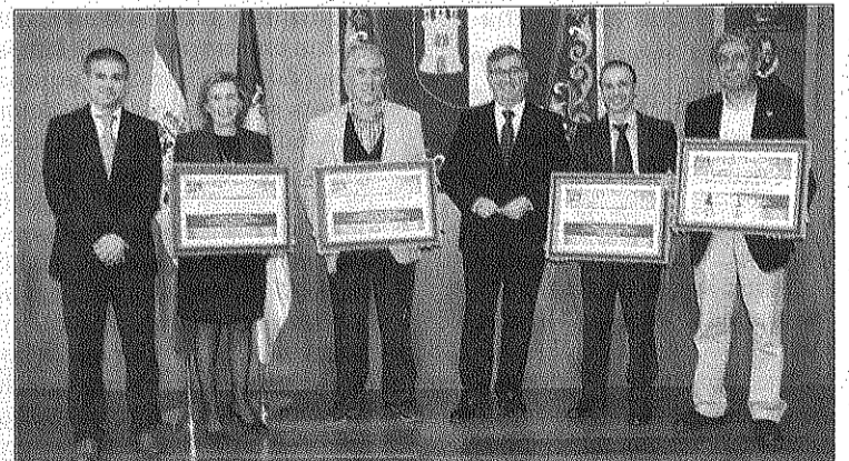
Los responsables de los centros recibieron placas acreditativas de su patrimonio.

Tal y como puso de manifiesto el titular de Educación, tras el Plan Pidal de 1845 se redujeron a diez las universidades en nuestro país y se procedió a la conversión de muchas de ellas en institutos provinciales de Segunda Enseñanza, centros que heredaron los bienes muebles e inmuebles de las antiguas universidades. En este caso, son los IES más antiguos de España los descendientes de aquellos institutos provinciales, los cuales conservan gran parte de los bienes que forman el Patrimonio Histórico Educativo.