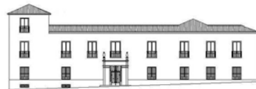
FACULTAD DE HUMANIDADES DE TOLEDO