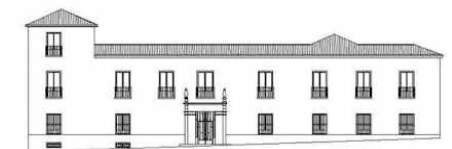
FACULTAD DE HUMANIDADES DE TOLEDO